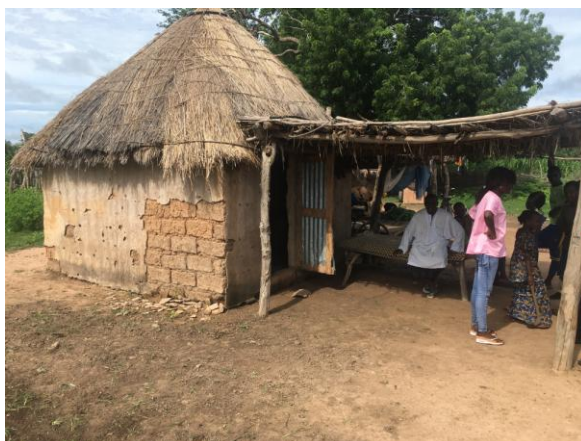
Case de santé de Werdouby et attente

L'après midi au retour a été consacrée à une séance de formation continue appréciée par le personnel concernant : la fièvre de l'enfant et les infections virales de l'enfant.