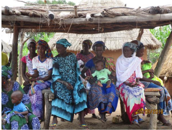
Femmes pendant la causerie