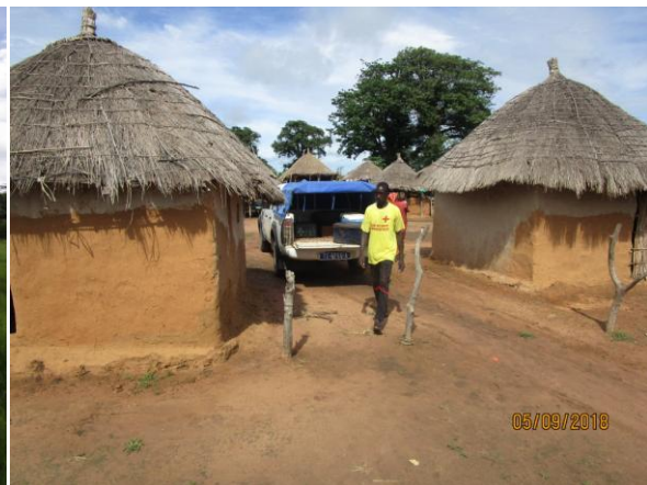
arrivée à Bantambaly