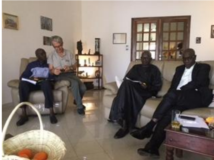
Reunion du CA