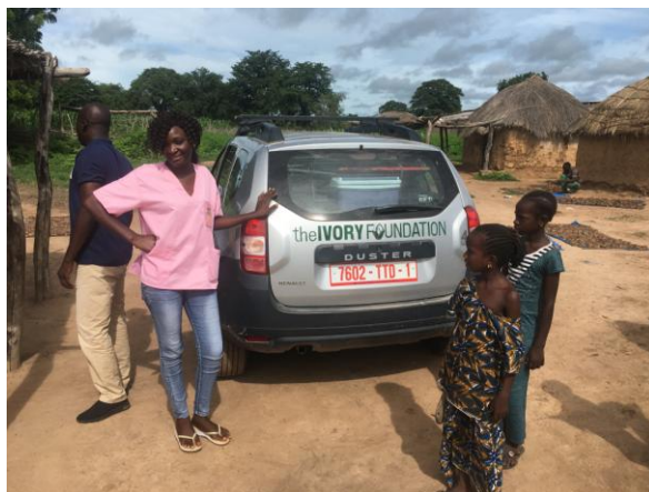
Sage femme et véhicule