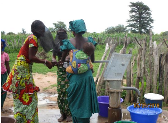
Pompe installée par « Eau Claire », jeunes mariées avec voile noir traditionnel !