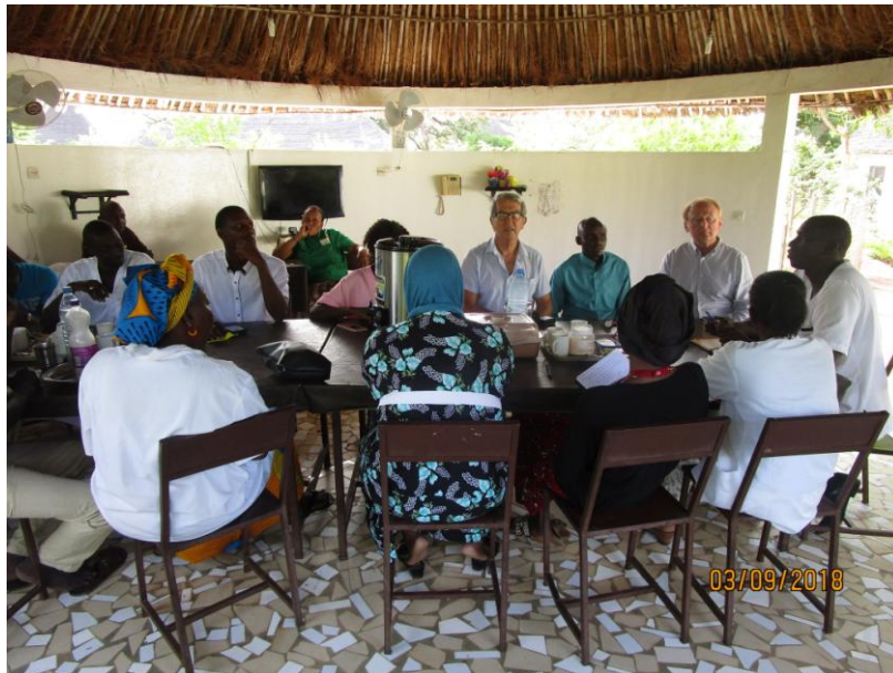
Réunion hebdomadaire du personnel