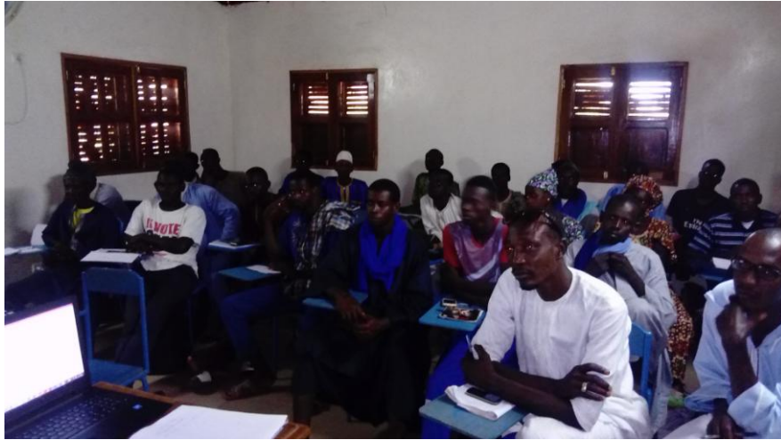
Les agents de santé des villages réunis à la salle polyvalente