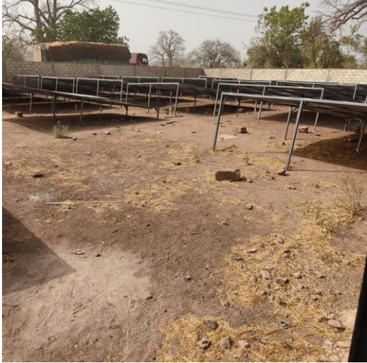
Champ solaire en construction