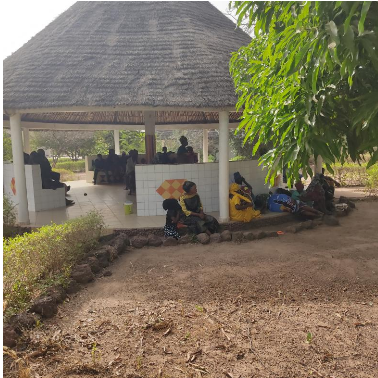
Salle d'attente dans l'agora

Le samedi matin le centre déborde de patients car les habitants des villages convergent vers Bala pour le marché hebdomadaire.